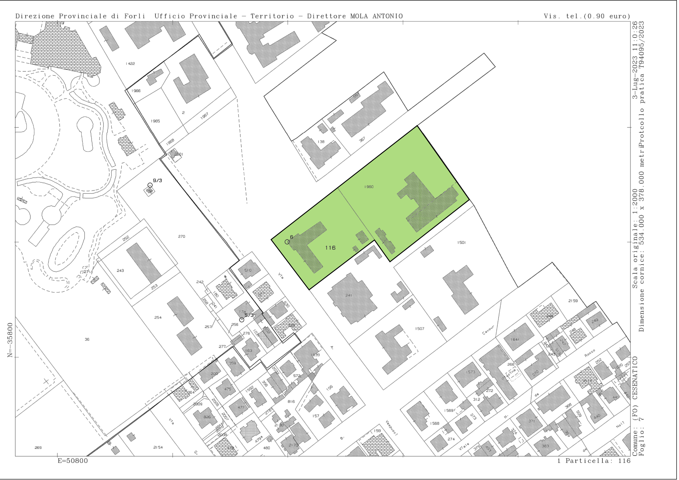
ESTRATTO DI MAPPA scala 1:2000 Fg.7 p.lle 116 e 1960 via G. Pian Del Carpine n.22 - 24