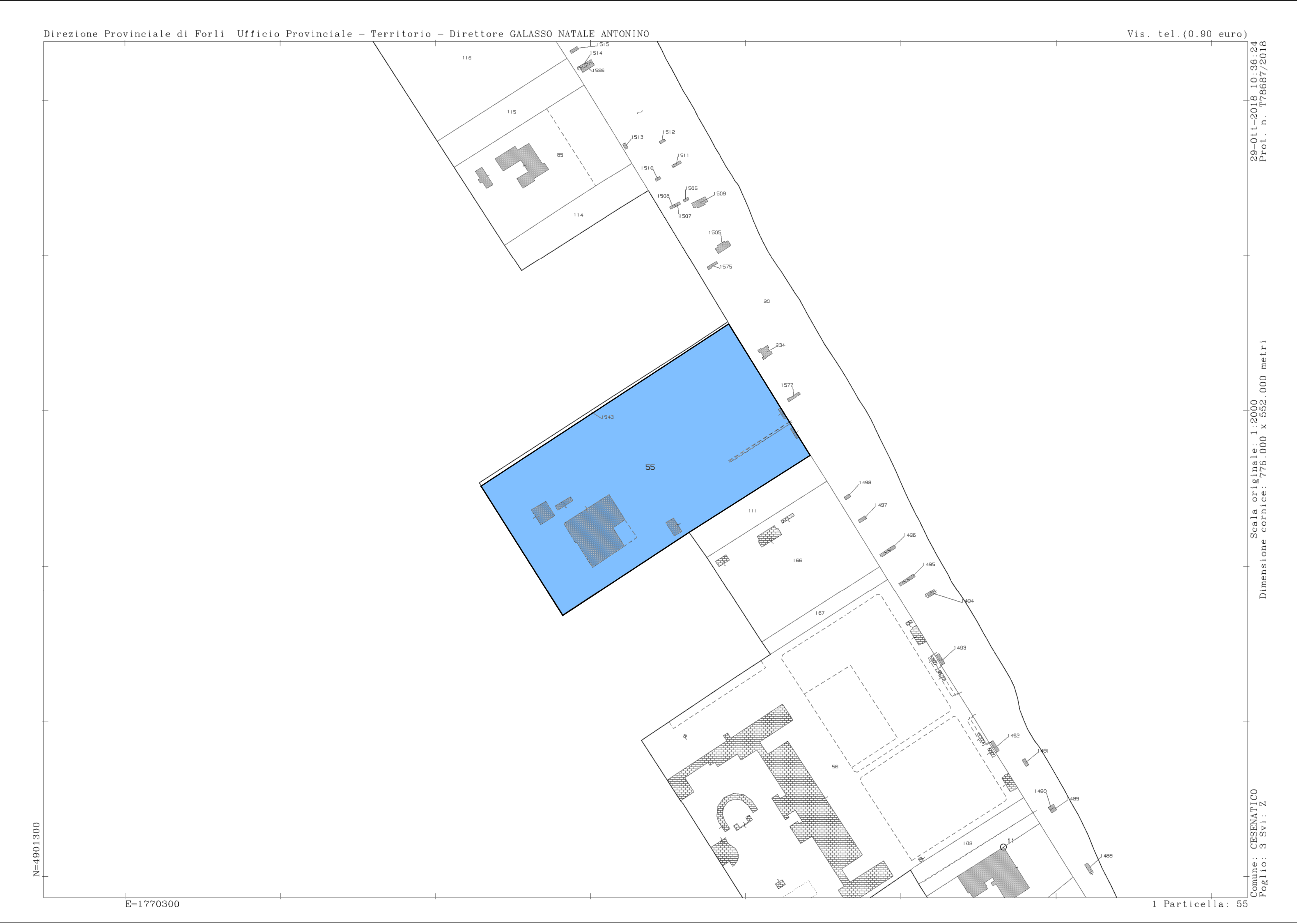
ESTRATTO DI MAPPA scala 1:2000 Fg.3 p.lle 55 via C. Colombo n.18